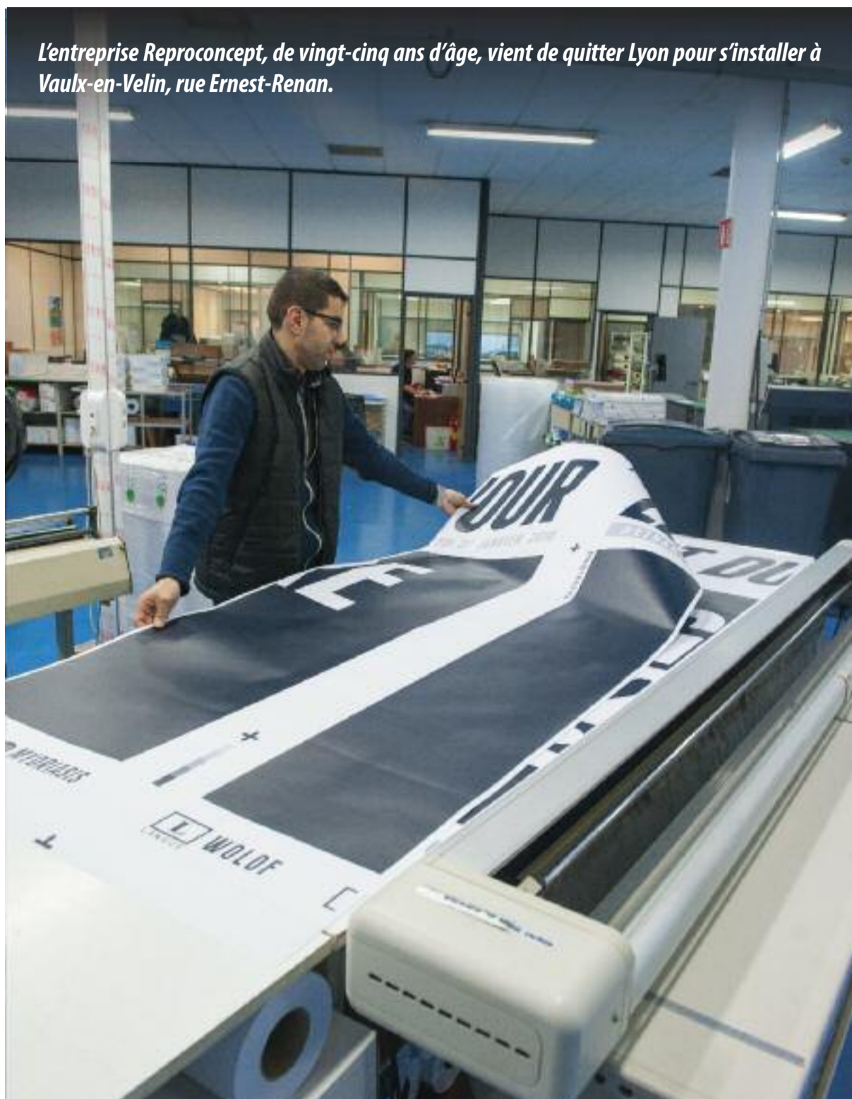
L'entreprise Reproconcept, de vingt-cinq ans d'âge, vient de quitter Lyon pour s'installer à Vaulx-en-Velin, rue Ernest-Renan.

50 rue Ernest-Renan. Tel: 04 78 62 79 95