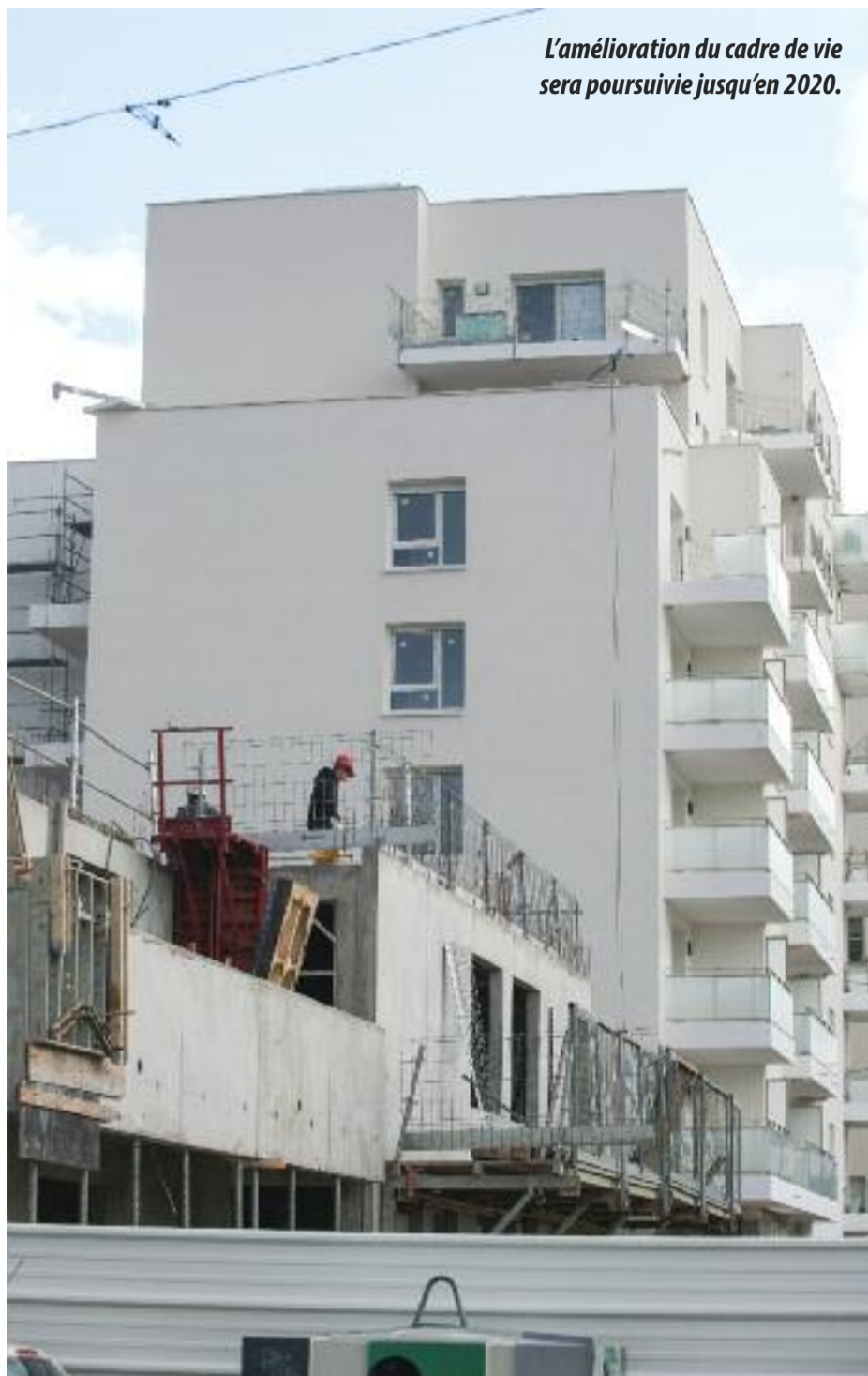
L'amélioration du cadre de vie sera poursuivie jusqu'en 2020.