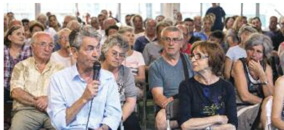
La démocratie participative est aussi au programme du plan de mandat.

En matière culturelle, la ville va développer le pôle scientifique avec le remplacement du simulateur du Planétarium (1,2 millions d'euros) et l'aménagement du jardin scientifique. Sur le plan sportif, des aménagements seront réalisés aux gymnases Rousseau, Blondin et Wallon, ainsi qu'au stade Ladoumègue. En même temps, une réflexion sera engagée sur le site Aubert et le Palais des sports, et la piscine Jean-Gelet sera rénovée (4,2 millions d'euros). Un pétanquodrome est aussi prévu d'ici la fin du mandat. Autres préoccupations affichées par la ville : une amélioration des démarches pour les usagers des services municipaux, le développement des politiques en direction de la jeunesse, de l'insertion et de l'emploi (dont 45 emplois d'avenir), et le lancement d'une bourse au code de la route pour les moins de